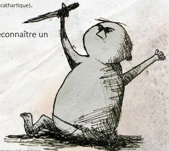
Illustration Edward Gorey

Adultes et enfants peuvent se retrouver et se reconnaître un petit peu (parfois beaucoup) dans Crâsse .